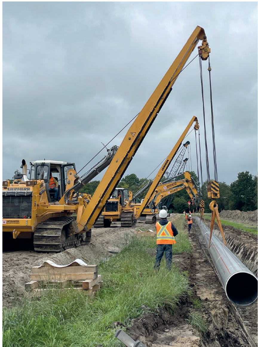
Abb. 4: Absenkung eines Rohrstrangs in den Rohrgraben

Das Projekt ist weiter auf Kurs und das Projektteam zuversichtlich, den Bau der Zukunftsleitung erfolgreich zum Jahreswechsel abschließen zu können. Der Bau ist eine komplexe Aufgabe, die eine enge Zusammenarbeit vieler Fachleute er- ▶