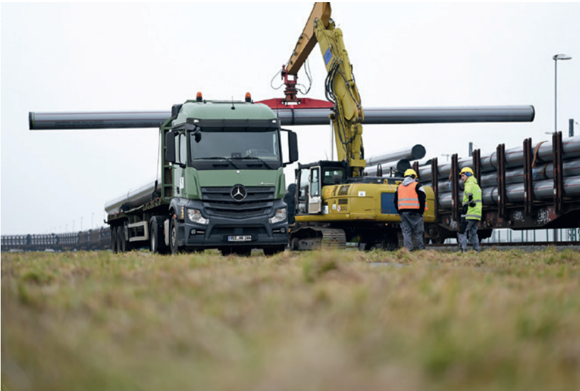
Abb. 2: Anlieferung der Rohre für die Zukunftsleitung per Bahn

Kreuzungen von vorhandenen Infrastrukturen.